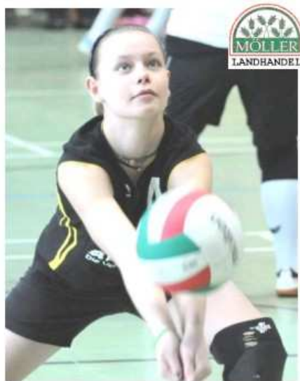
Mehr als Worte sagen Bilder! Impressionen C-Jugend 08/09